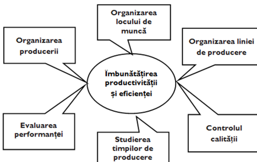
Figura 2. Ariile în care a fost acordată consultanță pentru creșterea productivității în fabricile de confecții.